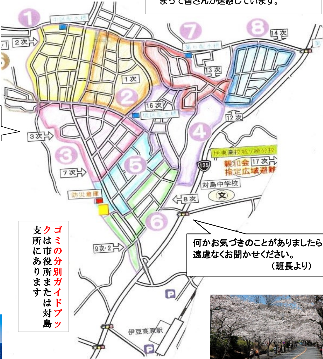
第2地区の班の区域割図

班長経験者からの声 ダンボールをゴミステーションのケージの中に回収日よりずっと前に出されると、生ごみがケージの中にはいらなくなってしまって皆さんが迷惑しています。