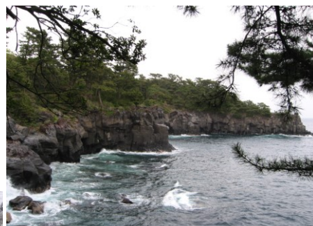
つり橋から八幡野の海岸を望む

伊豆高原には散歩のスポットがたくさん。荒々しい自然を感じることでできる橋立のつり橋周辺は、八幡野の海や伊豆大島を横目にしながらの絶好の散歩コースです。