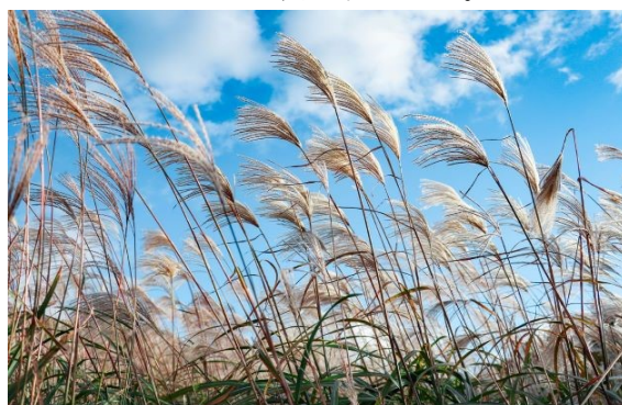
伊豆の風に揺れるススキ