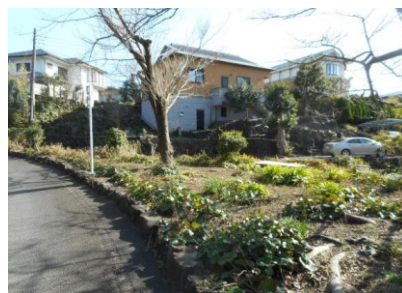
ベンチのある緑地